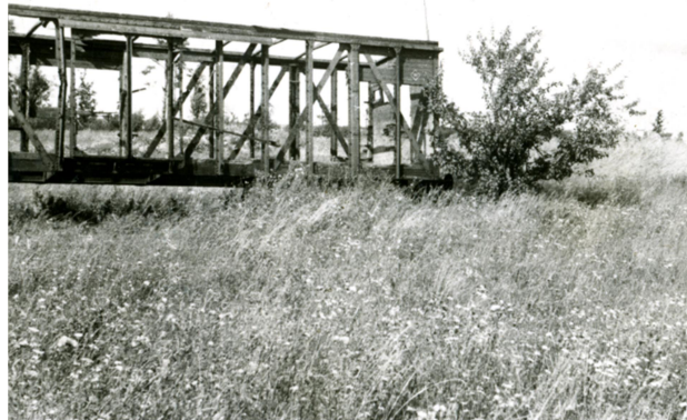
Rumbas stacija. Atliekas no dzelzceļa līnijas