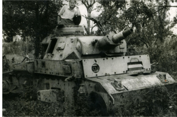
Uz vācu tanka vraka pie Rumbu mājām

Cīņu vietā - pie Lestenes luterāņu baznīcas izveidotā piemiņas vieta ar Lestenes memoriālu - vēsta par traģiskajiem notikumiem Otrā pasaules kara laikā, glābā kritušo un mirušo latviešu karavīru un nacionālo partizānu piemiņu.