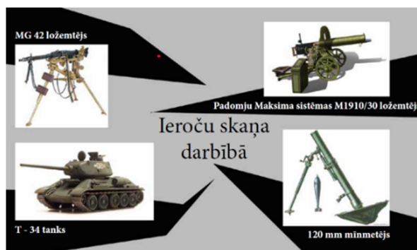
Ieroču darbības skaņas ekrāns.

Atmiņu šūnas - ziedojumu/dāvinājumu telpa. Katram ziedotājam un dāvinātājam paredzēta sava goda vieta.