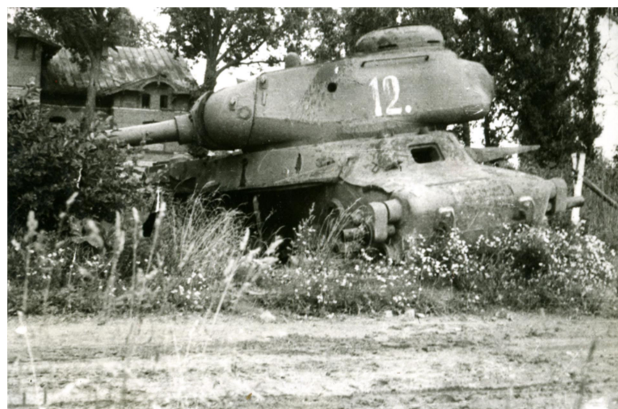
Tanku vraks pie Rumbu mājām