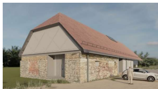
"Livland" arhitektu vizualizācija

Muzejs būs publiski pieejama, emocionāli uzrunājoša piemiņas vieta Kurzemes kaujās kritušajiem latviešu karavīriem abās kara pusēs. Te varēs uzzināt par Kurzemes lielkauju gaitām, iepazīt vietējo iedzīvotāju un latviešu karavīru stāstus, kā arī Latviešu leģiona vēsturi. Viesi varēs pētīt, kas kara laikā notika ar viņu ģimenes un dzimtas locekļiem, tāpat būs iespēja ierunāt savu dzimtas stāstu. Muzejs darbosies kā jauniešu izglītības centrs ar klases telpu, lai palīdzētu jaunajai paaudzei izprast savas tautas patieso vēsturi un mudinātu jauniešus iesaistīties valsts aizsardzības spēkos.