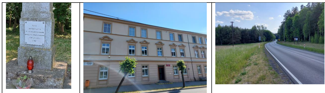
Attēlos redzami: 1) Šlēsinas padomju kapi, kur, ļoti iespējami, apbedīti latviešu leģionāri 2) Bijušā skola Więcborkā (vācu okupācijas laikā Vansburgā), kur bija pirmā kaujas lazarete* 3) Nāves ceļa posms pie Lędyczek (Landeck) tilta, kur notika izmisīgas cīņas.