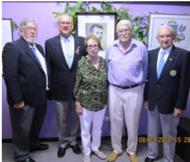
49 - Pēc Leģiona dienas atceres sarīkojuma.