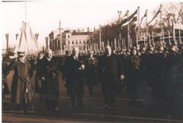
31 - Pieminekļa atklāšana 1935. gadā: ģenerālis Balodis, Ulmanis un Valsts prezidents Kviessis.

atklāja pieminekli 1935. gadā (skat zemāk) un papildus 8 karogi tika izvietoti pusaplīapkārt piemineklim (četri karogi katrā pusē).