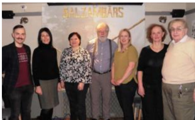
15 - DVF LN valde (no