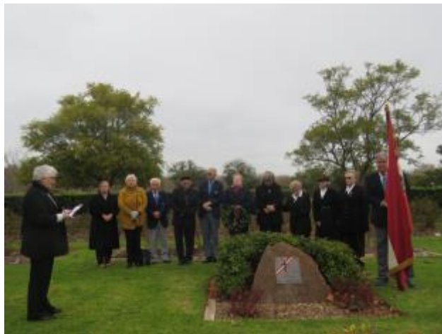
42 - Jūnijā (Austrālijas ziemā) ierobežotā skaitā Centennial parkā pie Latviešu akmens noturējām Aizvesto piemiņas a tceri.

Vanadzēs sāka gatavot ik sestdienas pusdienas. Cilvēki bija noiļģojušies pēc tikšanās klātienē un sarunām, pārrunām; čaloja kā strautiņi pavasarī, bet atkal pulcēšanās laika limits.