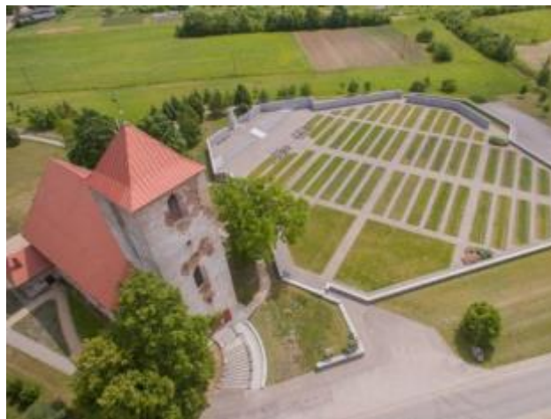
6 - Foto - Lestenes baznīca un kapi