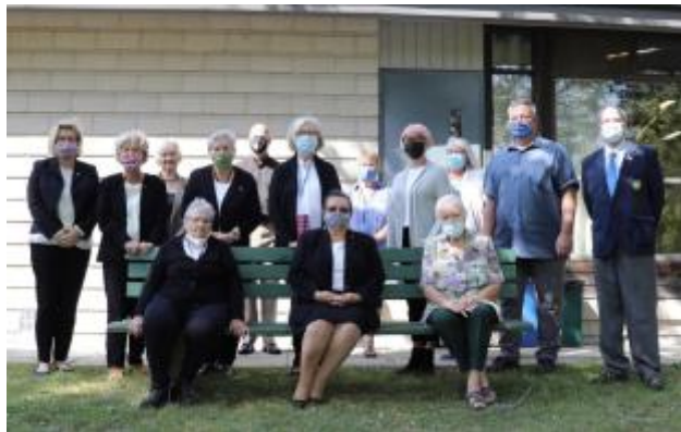
20 - DV Kanādas biedru pilnsapulce

Kanādas valde un nodaļas turpināja atbalstīt leģionārus - zāļu iegādei, daudz bērnu ģimenēm, audžuģimeņu biedrībai. Turpinājām mūsu augstskolu stipendiju atbalstus, kaut studenti mācījās attālināti.