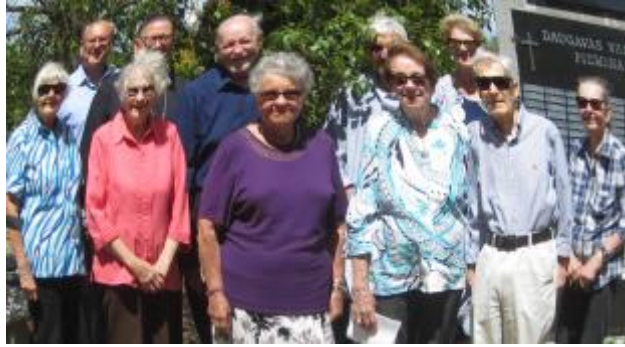
48 - Kapu svētku dalībnieki Pertas nodaļa