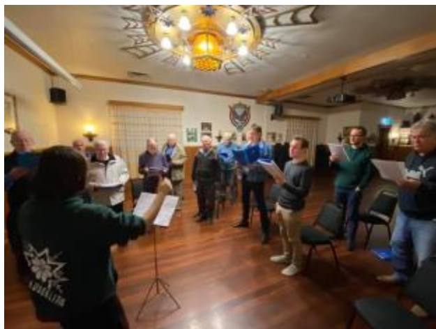
43 - Nodaļas vīru koris "Daugava" savā 51. darbības gadā mēģinājumus noturēja, ievērojot valdības noteiktos ierobežojumus