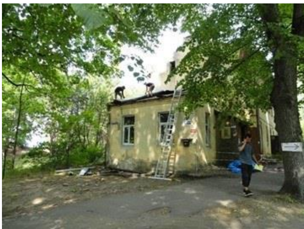
33 - Darbs pie ēkas 003 jumta.