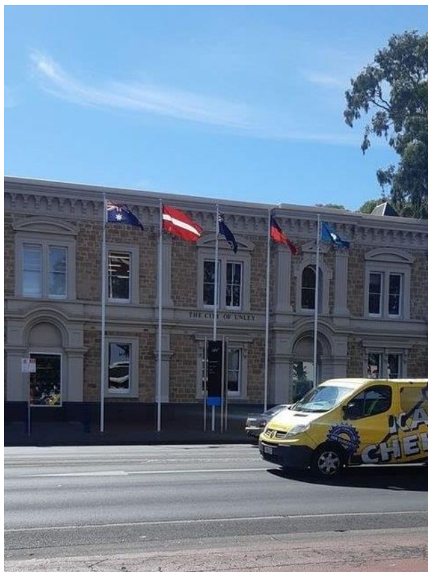
45 - Lāčplēšu sarīkojums 18. novembrī un Latvijas karogi Adelaides priekšpilsētās