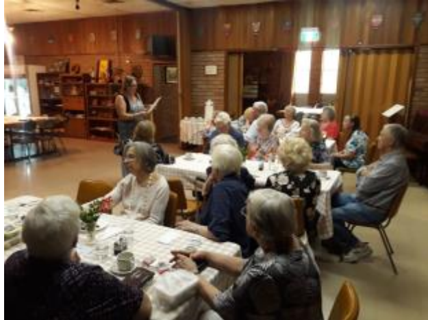
60 - 2020. g. marta pusdienas. DV Sidnejas nodaļas namā.