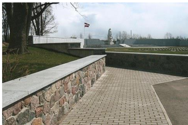
35 - Lestene – Latviešu leģionāru brāļu kapi.