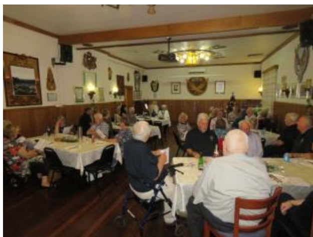
47 - Un tad ja u klāt Ziemsvētku noskaņa, kā parasti bez sniega