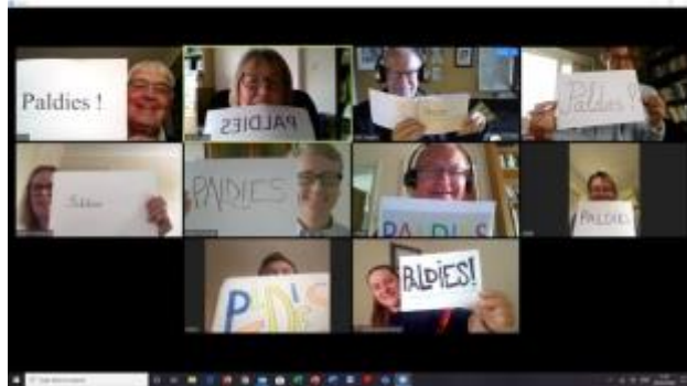
12 - DVF valde

Ņemot vērā pandēmijas ierobežojumus, Apvienotajā Karalistē nodaļu darbs bija stipri limitēts.