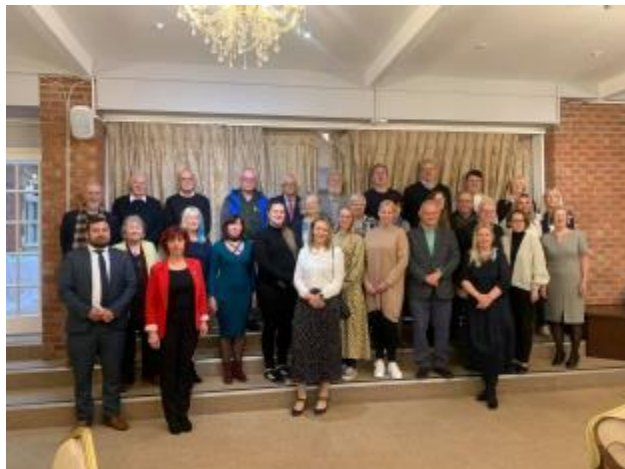
10 - DVF delegātu sapulce

DVF valde tomēr ir bijusi rosīga. Jaunie apstākļi ir likuši mums lietas pārdomāt un pārkārtot, kamēr šis ir bijis izdevīgs laiks līdzekļu ieguldīšanai mūsu īpašumos tālākai attīstībai. Valdes sēdes notiek regulāri, reizi mēnesī izmantojot Zoom