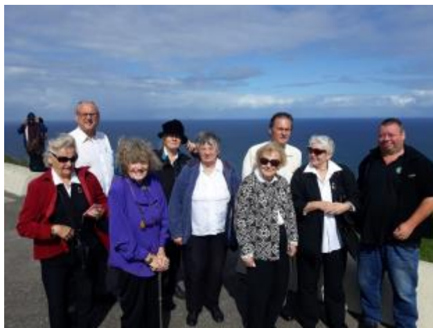
55 - Izbraukuma dalībnieki pie "Bald Hill lookout" bauda skatu uz kluso okeānu.

2020.gada februārī, DV namā notika gadskārtējā latviešu dāvināto grāmatu šķirošana un pakošana. Grāmatas, galvenokārt trimdas autoru darbi, rūpīgi salikti kastēs un sūta uz Latvijas lauku skolām, muzejiem, bibliotēkām un Daugavas Vanagiem Latvijā. Atsauksmes no grāmatu saņēmējiem ir pozitīva