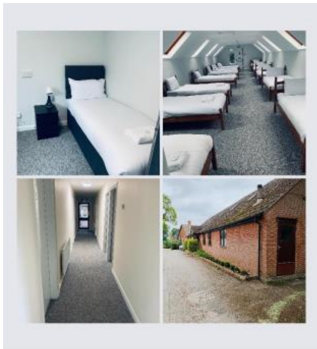
13 - Jaunais remonts Baltiešu blokā Straumēnos