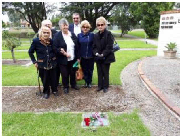
39 - Daļa dalībnieki Leģiona dienas svētkos Fawkner kapsētā Melburnas nodaļa

Pie Melburnas nodaļas pastāv divas nozares: vanadžu kopa un novusa klubs. Arī abām nozarēm klātienes darbs apsīka no marta. Vanadzēs tomēr turpināja darboties aprūpes laukā, apzvanot mūsu vecākos nodaļas biedrus un tautiešus un, kad ierobežojumi atļāva, arī tos apciemojot un izpalīdzot, kur bija vajadzīgs. Sirsnīgs paldies vanadzēm par lielo darbu. Arī pandēmijas laikā vanadzēs turpināja aktīvi darboties un rūpēties par mūsu nodaļas biedriem.