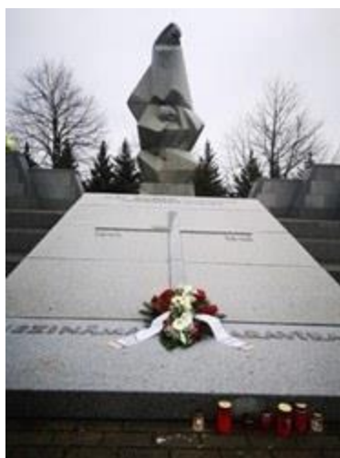
36 - Lestēnē – “Nezināmais karavīrs”.

Daugavas Vanadžu organizācijas vadītājas Klāras Mētras darba pārskats par 2018. 2019 un 2020 gadu.