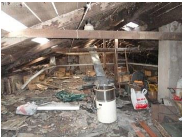
32 - Darbs pie ēkas 004 jumta.

COVID-19 ierobežojumiem, kas ietekmē darbu. Saimniecības nozare Andra Stakļa vadībā turpina savu darbu, lai uzlabotu DVL īpašumu infrastruktūru; ar Austrālijas DV Sidnejas nodaļas atbalstu ir uzlikts jauns jumts ēkai 004, kas praktiski izglāba ēku no bojāejas.