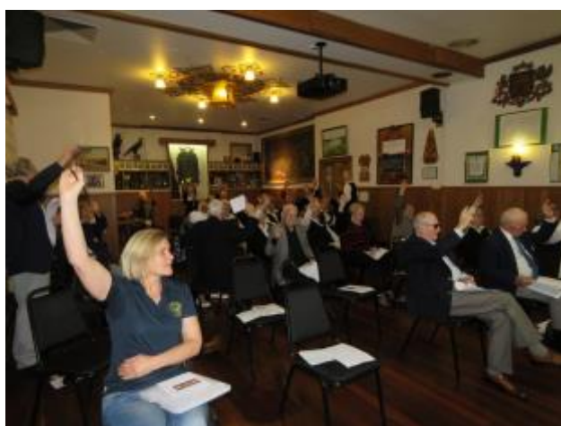
44 - Kārtējā nodaļas pilnsapulce septembrī