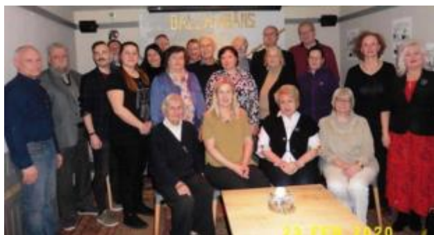
16 - 2020. gada DVFLN pilnsapulces dalībnieku kopbilde